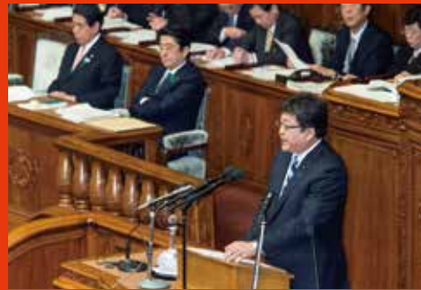
60年振りの教育委員会制度改正に向け代表質問