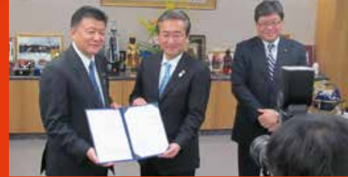
中核市決定、新藤総務大臣より認定書を授与