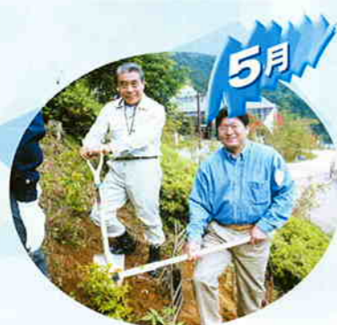
アイス力森づくり (タヤけ小やけふれあいの里が会場)