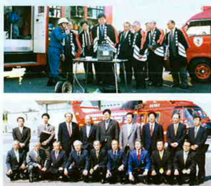
自民党三多摩支部の視察(立川消防訓練所)