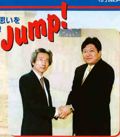
八王子の熱き思いを 国政に届ける!