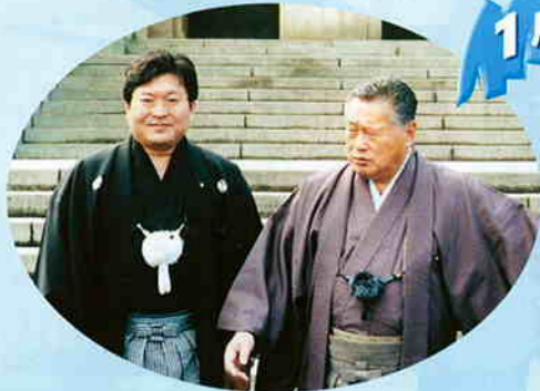
第159回通常国会 初登院