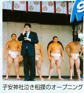
子安神社泣き相撲のオープニング