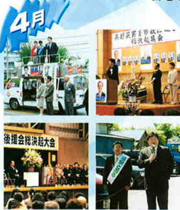
八王子市議選各地の応援