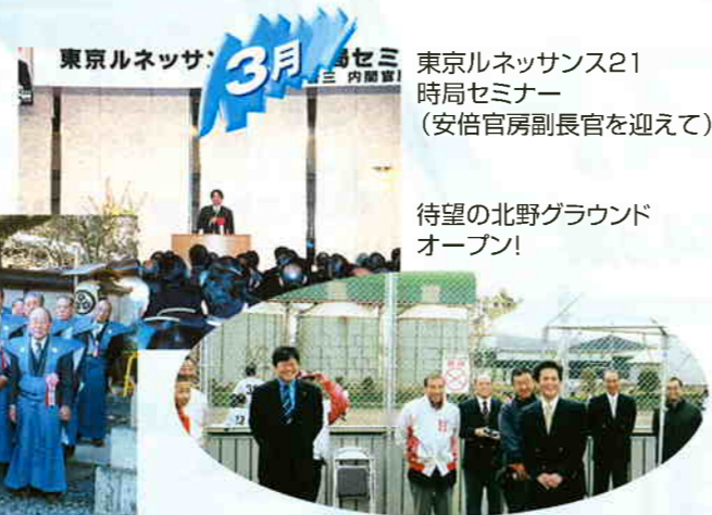
東京ルネッサンス21 時局セミナー (安倍官房副長官を迎えて)