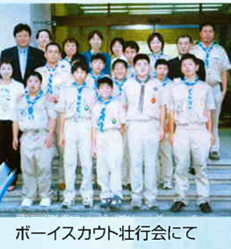
ボーイスカウト壮行会にて