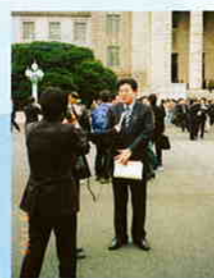
おかげさまで初登院